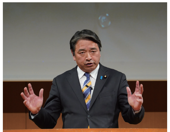
議案報告・提案を行う様葉幹事長