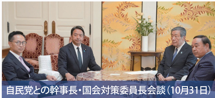
自民党との幹事長・国会対策委員長会談(10月31日)

これに先立ち、自民党、立憲民主党、日本維新の会、公明党の各党と幹事長・国会対策委員長会談、自民党、公明党とそれぞれ政調会長会談を行い、政策や法案などの案件ごとに協議することを確認しました。国民民主党は、衆議院選挙で掲げた政策の実現に向け全力で取り組んでいます。