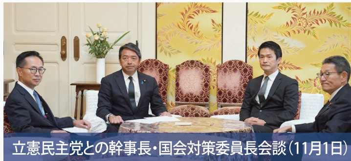
立憲民主党との幹事長・国会対策委員長会談(11月1日)